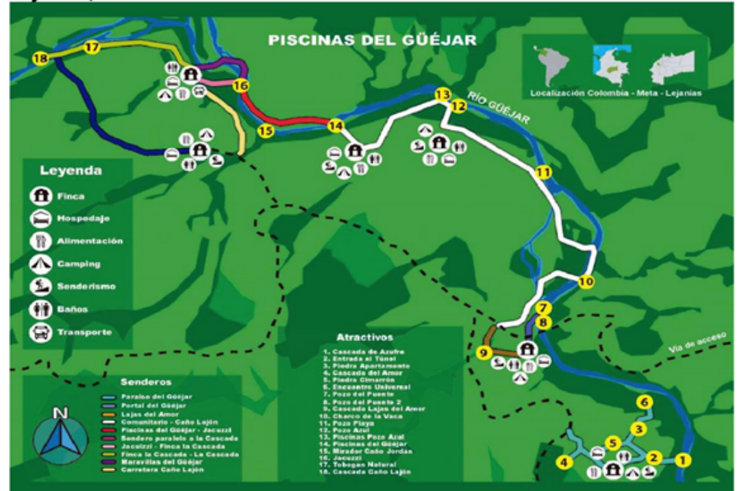
Imagen 1: Ubicación del sector de las piscinas del Güejar en el municipio de Lejanías, Meta.

Promueve relaciones de buena vecindad, confianza, convivencia y solución pacífica de conflictos